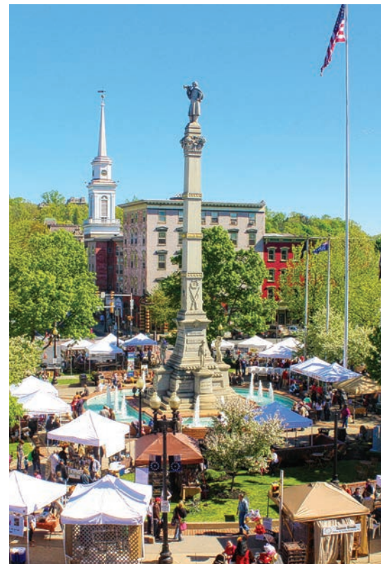
Les clients se retrouvent au marché des producteurs d'Easton.