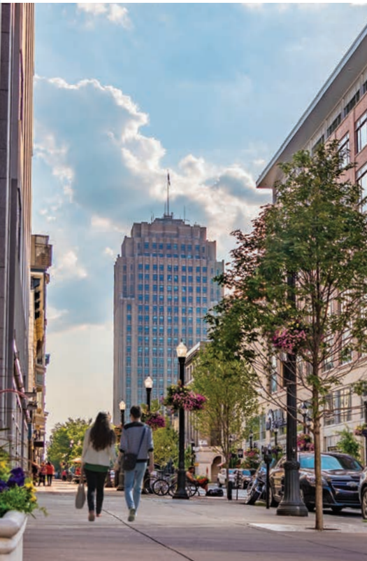
Die Einwohner genießen einen Abend in der Innenstadt von Allentown.