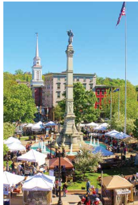
Os clientes se reúnem no mercado Easton Farmers.