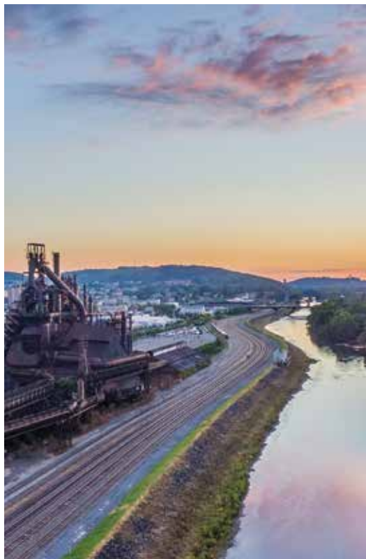
Por do sol sobre o rio Lehigh, em South Bethlehem.