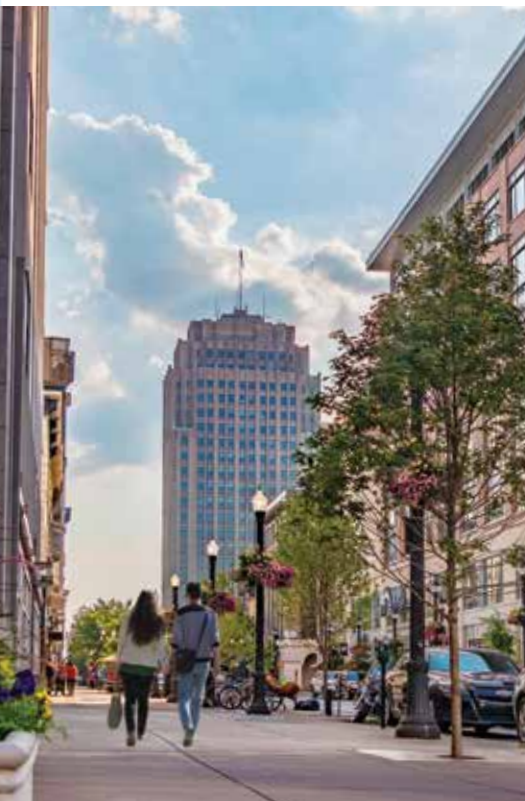
Moradores desfrutando um passeio à noite no centro de Allentown.